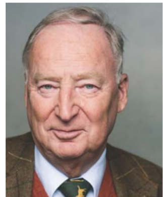
Dr. Alexander Gauland AfD