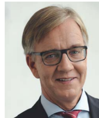
Dr. Dietmar Bartsch DIE LINKE.