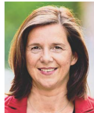
Katrin Göring-Eckardt Bündnis 90/Die Grünen