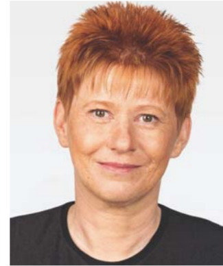
Petra Pau Vizepräsidentin, DIE LINKE.