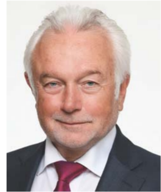
Wolfgang Kubicki Vizepräsident, FDP