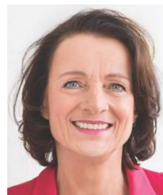
Sportausschuss Vorsitzende: Dagmar Freitag, SPD Mitglieder: 18 6 CDU/CSU 4 SPD 2 AfD 2 DIE LINKE. 2 Bündnis 90/Die Grünen