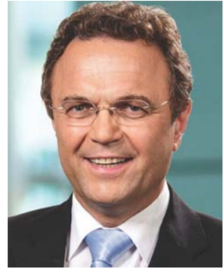
Dr. Hans-Peter Friedrich Vizepräsident, CDU/CSU