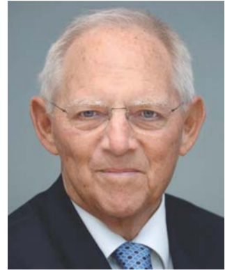
Dr. Wolfgang Schäuble Präsident des Deutschen Bundestages, CDU/CSU