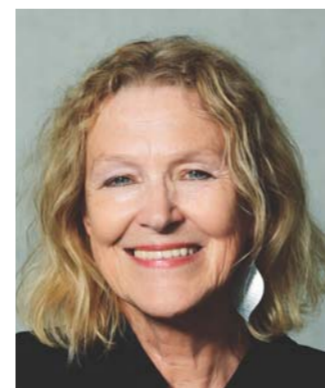
Ausschuss für Umwelt, Naturschutz und nukleare Sicherheit Vorsitzende: Sylvia Kotting-Uhl, Bündnis 90/Die Grünen Mitglieder: 39 14 CDU/CSU 9 SPD 5 AfD 4 FDP 4 DIE LINKE. 4 Bündnis 90/Die Grünen