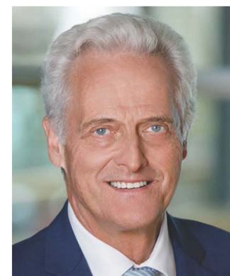
Ausschuss für wirtschaftliche Zusammenarbeit und Entwicklung Vorsitzender: Dr. Peter Ramsauer, CDU/CSU Mitglieder: 24 9 CDU/CSU 6 AfD 3 AfD 3 FDP 3 DIE LINKE. 2 Bündnis 90/Die Grünen