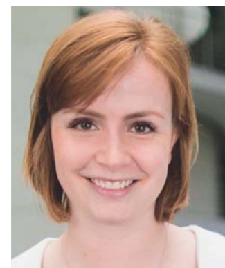
Ausschuss für Menschenrechte und humanitäre Hilfe Vorsitzende: Gyde Jensen, FDP Mitglieder: 17 6 CDU/CSU 3 SPD 2 AfD 2 FDP 2 DIE LINKE. 2 Bündnis 90/Die Grünen