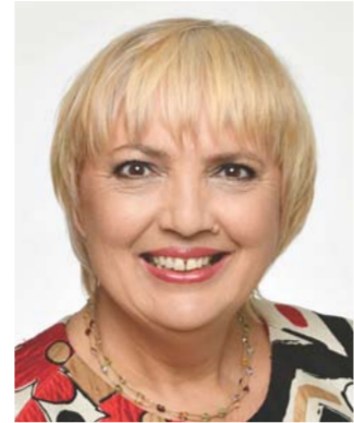
Claudia Roth Vizepräsidentin, Bündnis 90/Die Grünen