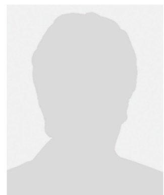
Ausschuss für Recht und Verbraucherschutz Vorsitz: N.N. (AfD) Mitglieder: 43 15 CDU/CSU 9 SPD 6 AfD 5 FDP 4 DIE LINKE. 4 Bündnis 90/Die Grünen