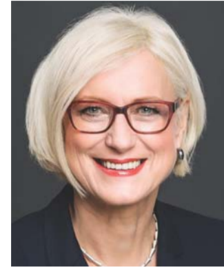
Dagmar Ziegler Vizepräsidentin, SPD