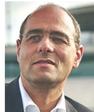
Haushaltsausschuss Vorsitzender: Peter Boehringer, AfD Mitglieder: 44 15 CDU/CSU 10 SPD 6 AfD 5 FDP 4 DIE LINKE. 4 Bündnis 90/Die Grünen