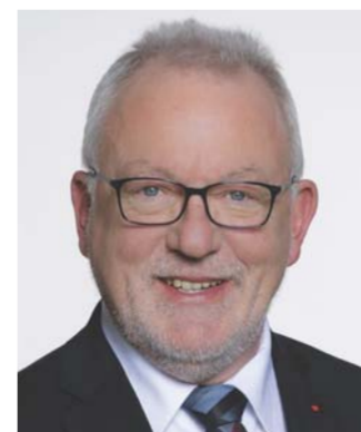
Verteidigungsausschuss Vorsitzender: Wolfgang Hellmich, SPD Mitglieder: 36 12 CDU/CSU 8 SPD 5 AfD 4 DIE LINKE. 3 Bündnis 90/Die Grünen