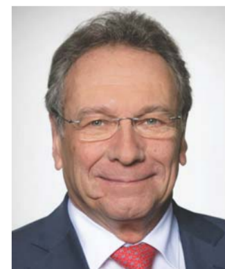
Ausschuss für Wirtschaft und Energie Vorsitzender: Klaus Ernst, DIE LINKE. Mitglieder: 49 17 CDU/CSU 11 SPD 6 AfD 5 FDP 5 DIE LINKE. 5 Bündnis 90/Die Grünen