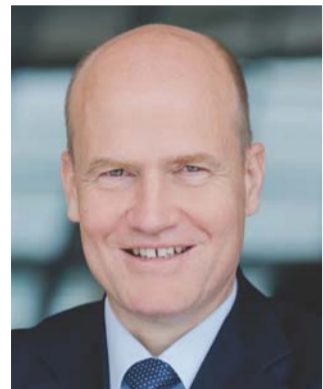
Ralph Brinkhaus CDU/CSU