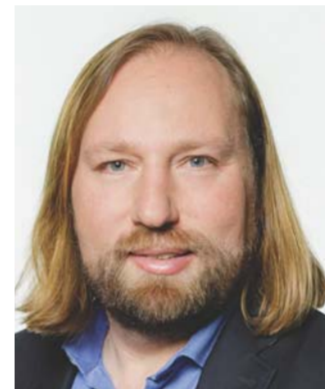
Dr. Anton Hofreiter Bündnis 90/Die Grünen