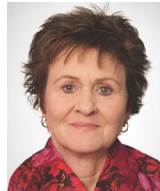
Ausschuss für Familie, Senioren, Frauen und Jugend Vorsitzende: Sabine Zimmermann, DIE LINKE. Mitglieder: 40 14 CDU/CSU 5 AfD 5 FDP 4 DIE LINKE. 4 Bündnis 90/Die Grünen