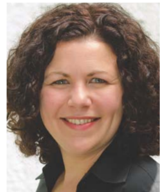
Amira Mohamed Ali DIE LINKE.