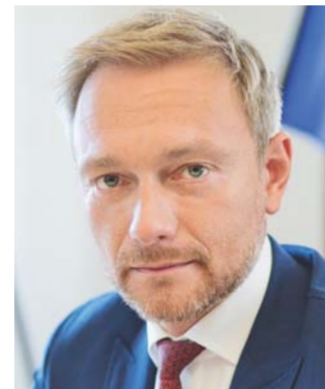
Christian Lindner FDP