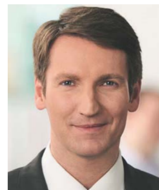
Ausschuss für Wahlprüfung, Immunität und Geschäftsordnung Vorsitzender: Dr. Patrick Sensburg, CDU/CSU Mitglieder: 14 5 CDU/CSU 3 SPD 2 AfD 2 FDP 1 DIE LINKE. 1 Bündnis 90/Die Grünen