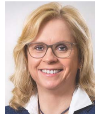
Ausschuss für Inneres und Heimat Vorsitzende: Andrea Lindholz, CDU/CSU Mitglieder: 46 16 CDU/CSU 10 SPD 6 AfD 5 FDP 4 DIE LINKE. 4 Bündnis 90/Die Grünen 1 fraktionslos