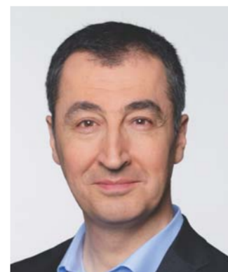
Ausschuss für Verkehr und digitale Infrastruktur Vorsitzender: Cem Özdemir, Bündnis 90/Die Grünen Mitglieder: 43 15 CDU/CSU 9 SPD 6 AfD 5 FDP 4 DIE LINKE. 4 Bündnis 90/Die Grünen