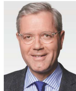
Auswärtiger Ausschuss Vorsitzender: Dr. Norbert Röttgen, CDU/CSU Mitglieder: 45 16 CDU/CSU 10 SPD 6 AfD 5 FDP 4 DIE LINKE. 4 Bündnis 90/Die Grünen